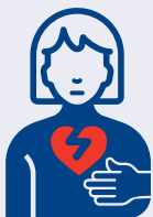
ቃንዛ ኣፍ ልቢ ወይ ምትራር ኣፍ ልቢ

ኣምቡላንስ በሉ ደውልኩም ድማ ናብ ብቐዕ ተቐባል ቴላፎን ክተሓተዝ እዩ። ንሱ ድማ ናትኩም ሕክምናዊ ኢመርጅንሲ ክግምግም እዩ። ናይ ሰለስተ ዜሮ (000) ደውል ተቐባልቲ ድማ ኣዝዮም ኪኢላታትን ስልጠና ዝወሰዱን እዮም። ነቲ ኢመርጅንሲ ድማ ቀልጢፎም ይግምግሙን በዚ ድማ ንስኹም እቲ ግቡእ ሓገዝ ኣብ'ቲ ትኸክል ግዜ ድማ ትውሃቡ።