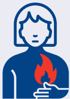
ግዝፍ ዝበለ ምንዳድ