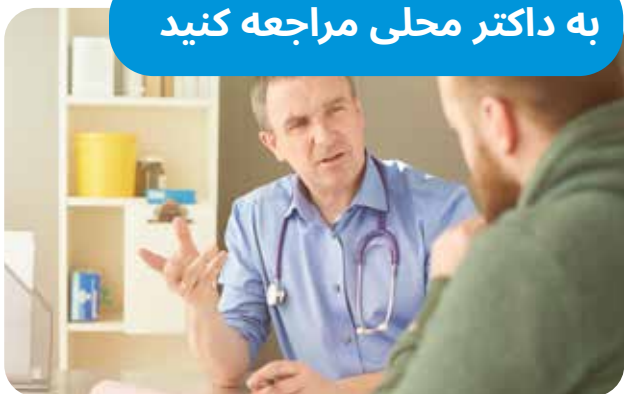
13SICK داکتر خانگی ملی