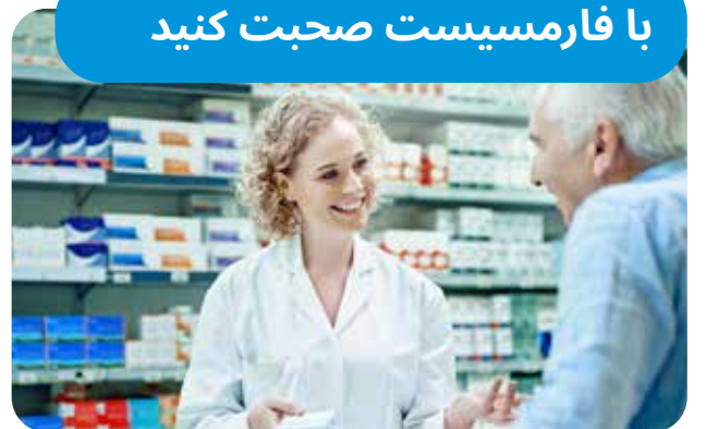
دواخانه‌های Supercare ویکتوریا

عضو سرویس امبولانس ویکتوریا شوید. برای عضویت آسان، به آدرس ذیل مراجعه کنید