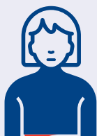
شدید وینه بهیدنه